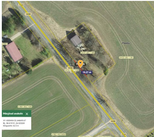
Joonis 1. Ristumiskoha võimalik asukoht km 5,07-5,09